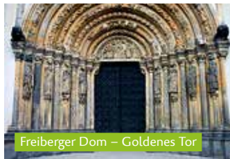
Freiberger Dom – Goldenes Tor